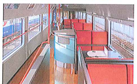
2号車ラウンジでは「銘酒ふるまいコーナー」