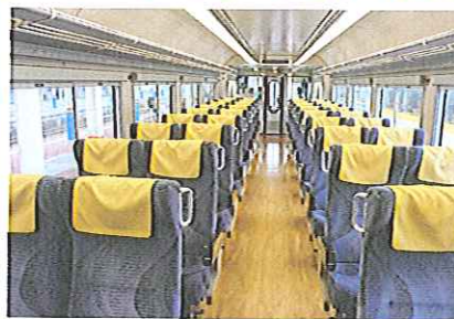
列車ならではのゆったりシートの明るい車内